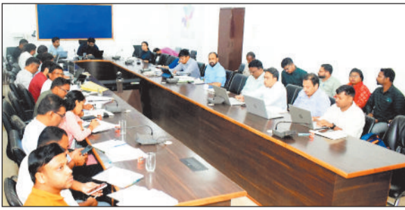
समीक्षा बैठक लेते कलेक्टर।