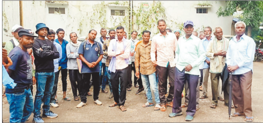
उचित मुआवजे की मांग के लिए कलेक्टरों पहुंचे किसान।

केंद्र सरकार की महत्वाकांक्षी भारतमाला योजना के लिए जिले में भूमि अधिग्रहण की प्रक्रिया चल रही है। अधिग्रहण की इस प्रक्रिया के दौरान किसानों ने जिला प्रशासन से उचित मुआवजा दिलाने की गुहार लगाई है। किसानों का कहना है कि उनकी जमीन के बदले में जो राशि सरकार से मिल रही है, उससे वे दूसरी जमीन नहीं खरीद पा रहे हैं। ऐसे में वे भूमिहीन हो कर बेरोजगारी व भूखमरी का शिकार हो जाएंगे।