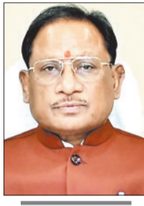
जल्द शुरू होगा निर्माण कार्य

जिले में नए भवन निर्माण के लिए पोस्ट मैट्रिक अनुसूचित जनजाति बालक छात्रावास जशापुर 1 करोड़ 92 लाख, पोस्ट मैट्रिक अनुसूचित जनजाति बालक छात्रावास लोदाम 1 करोड़ 53 लाख, प्री मैट्रिक अनुसूचित जनजाति बालक छात्रावास पैकु 1 करोड़ 53 लाख, पोस्ट मैट्रिक अनुसूचित जनजाति बालक छात्रावास मनोरा 1 करोड़ 92 लाख, पोस्ट मैट्रिक अनुसूचित जनजाति बालक