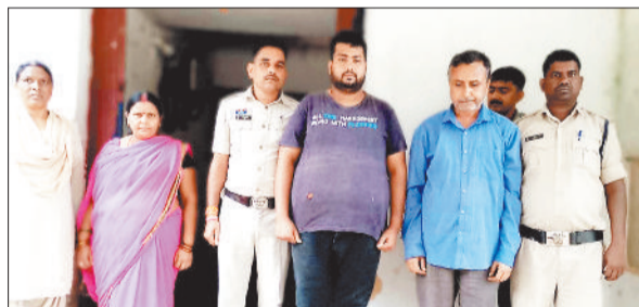
पुलिस गिरफ्त में टगी के आरोपी।

टगी के मामलों पर अंकुश लगाने पुलिस का विशेष अभियान ऑपरेशन अंकुश लागातर परिणाम दे रहा है। इसी कड़ी में पुलिस ने टगी के एक पुराने प्रकरण में तीन फरार आरोपियों को अंबिकापुर से गिरफ्तार कर न्यायिक रिमांड पर जेल भेज दिया है। पकड़े गए आरोपियों में एक महिला भी शामिल है। जबकि एक आरोपी अब भी पुलिस की पकड़ से बाहर है, जिसकी तलाश जारी है।