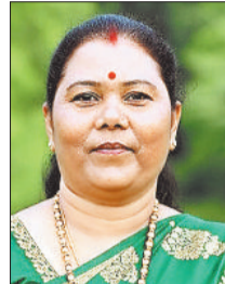
15 करोड़ 91 लाख रुपये स्वीकृत

पत्थलगांव विधानसभा को जिले में सर्वाधिक भवन निर्माण हेतु कुल 15 करोड़ 91 लाख रुपये की स्वीकृति मिली है। नए भवन निर्माण में पोस्ट मैट्रिक अनुसूचित जनजाति बालक छात्रावास कांसाबेल 2 करोड़ 89 लाख, पोस्ट मैट्रिक अनुसूचित जनजाति बालक छात्रावास दोकड़ा 1 करोड़ 92 लाख, प्री मैट्रिक अनुसूचित जनजाति बालक छात्रावास कांसाबेल 1 करोड़ 53 लाख, प्री मैट्रिक अनुसूचित जनजाति बालक छात्रावास दोकड़ा 1 करोड़ 53 लाख, प्री मैट्रिक अनुसूचित जनजाति बालक छात्रावास दोकड़ा 1 करोड़ 53 लाख, प्री मैट्रिक अनुसूचित जनजाति