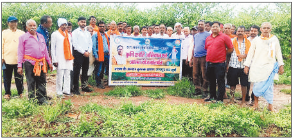
शैक्षणिक भ्रमण करते किसान।

जशापुरनगर। जिले में कृषि क्रांति अभियान अंतर्गत मुख्यमंत्री विष्णुदेव साय द्वारा हरी झंडी दिखा कर किसानों को शैक्षणिक भ्रमण पर भेजा गया है। भ्रमण में किसान रायपुर कृषि महाविद्यालय के टि.सु. कल्चर लैब में टि.सु. कल्चर की गुणवत्ता एवं विशेषता के बारे में तथा वी.एन.आर. सीड्स प्राइवेट लिमिटेड रायपुर में विभिन्न फसलों के उन्नत बीजों के उत्पादन तकनीक, उनके उत्पादन क्षमता, कीट रोग के प्रति प्रतिरोधकता इत्यादि की जानकारी ले रहे हैं। साथ ही रायपुर के हंडस मेगा फूड पार्क में विभिन्न फसलों के प्रसंस्करण इकाई के कार्यपालन एवं प्रसंस्करण के उपरान्त फसल के मूल्य एवं जीवनकाल में वृद्धि से बाजार मूल्य में वृद्धि की तकनीकी जानकारी प्राप्त कर रहे हैं। जिले के किसान कृषि विभाग अंतर्गत आत्मा प्रोजेक्ट एवं कृषि क्रांति अभियान अंतर्गत शैक्षणिक भ्रमण में जाएं तो वे किसान मुख्यतः कांसाबेल एवं कुनकुरी के उन्नतशैली कृषक एवं एफपीओ को सदर्श है।