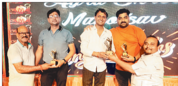
प्रतियोगिता में जीत हासिल करने वाले प्रतियोगी।